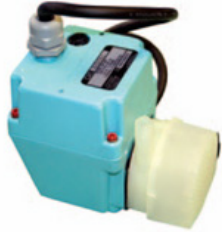
made in USA