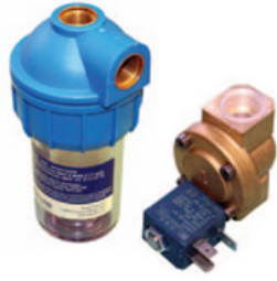
made in Italy / Germany