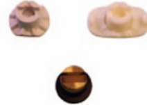
made in Japan